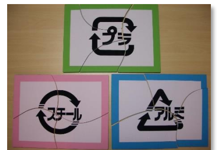
4つのピースでパズルが完成