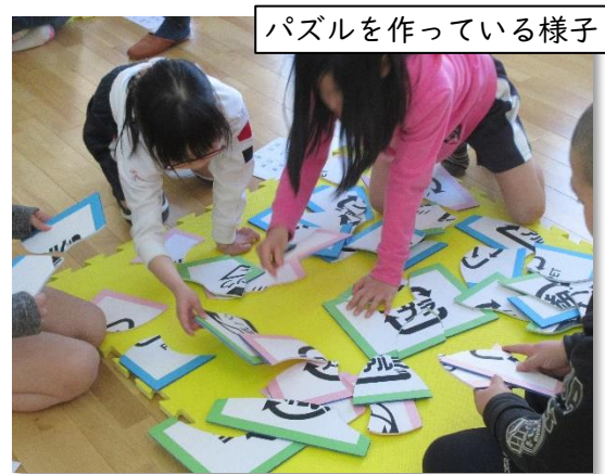
パズルを作っている様子