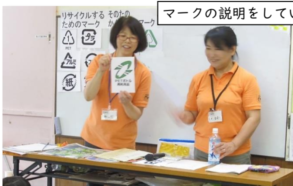
マークの説明をしているところ