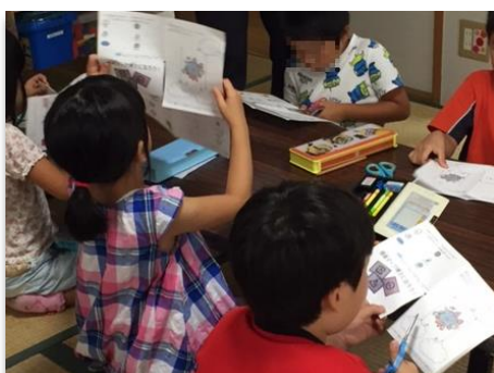
お土産教材「環境マーク博士になろう！」作成中