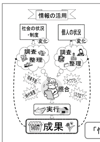
「情報の活用」図解して説明