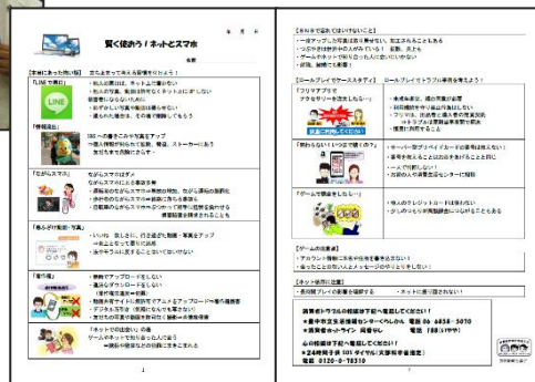
講座内容の 「まとめプリント」を配付

受講生アンケートより ・ネットにかかってに写真を上げたり悪口をのせるとすごく大変な事になると感じました。その他にもネットいぞんになるとやりすぎて勉強やねる時間がへって生活に影響がでると思いました。(中学) ・ネットの使い方をまちがえるとこんなにもこわいことがあるんだとあらためて考えることができました。これからはもっとネットを使うきかひが多くなると思うので、しっかりと考えて使おうと思いました。(中学) ・軽い気持ちで写真をとったり、SNS等であげたりしないようにしようと思った。写真をアップするときは個人情報などが入っていないかしっかり確認しようと思う。スマホは便利だけど、危険な面もあると分かったので気を付けて使おうと思いました。(高校) ・1度世の中にあげてしまったものはたとえすぐに消したとしても、誰か保存しているかもしれないし、もう消えることはないと改めて知って怖かった。1人の身勝手な行動で、何万人もの人にめいわくをかけてしまうことを知った。(高校) ・ながらスマホは絶対だめだと改めて思った。依存症にならないようにするにはルールを決めることが一番良い方法だと思った。(高校) ・スマホの利用についての話ですこしドキッとした。ネットの使い方やSNSへの向きあい方を改めようと思った。(高校)