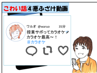
「本当にあった怖い話」 実際にあった事例をとりあげ、考える