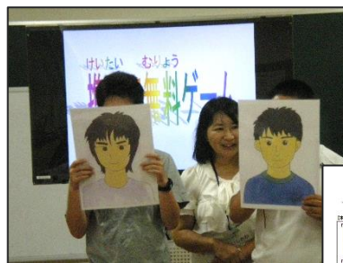
登場人物のフェイスボードを持って、ロールプレイ トラブル事例の疑似体験