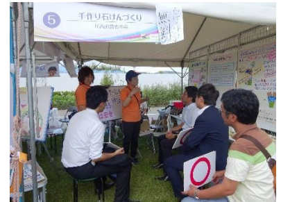
川西市サマーフェスタ 9/11