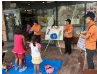
コープ三田西店 コープフェスタ 10/1