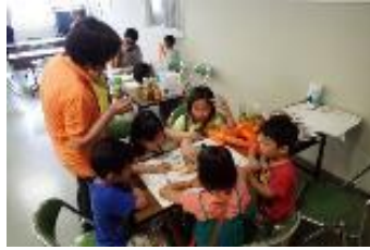
近畿ろうきん洲本住まいフェア-7/9