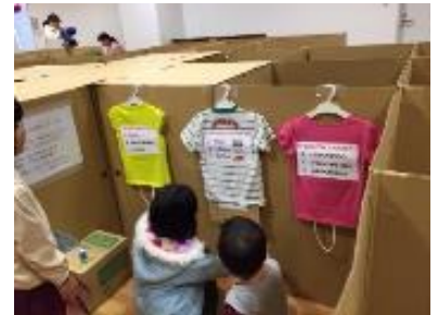
伊丹消費者のつどい 11/25