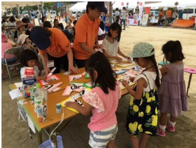
島本町消費者まつり 5/21

イベントに参加し、ミニ講座・工作・カードゲーム等で遊びながら学べる消費者教育を実践