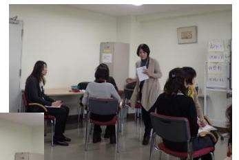
フリップを使った ワークショップ