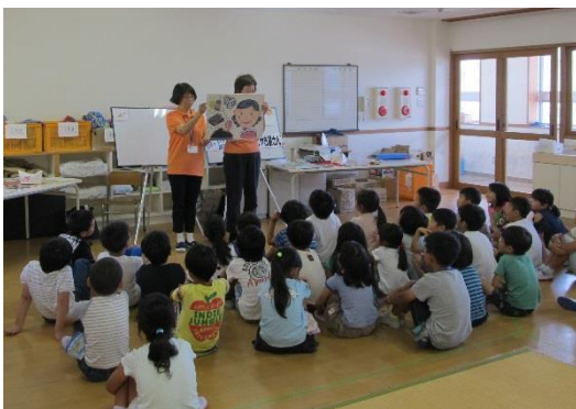
講座風景(河内長野放課後児童会) 金銭講座「Let'sトライ商売！“本日開店たこ焼き屋さん”」