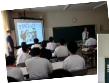
講座風景 「TPOってな～に？」