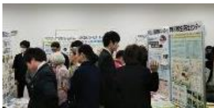
賑わう壁新聞 コーナー