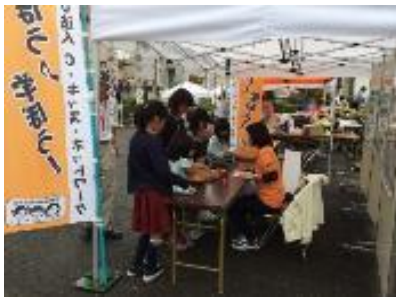
東大阪市消費生活展 10/7